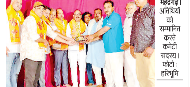
महेन्द्रगढ़। अतिथियों को सम्मानित करते कमेटी सदस्य।