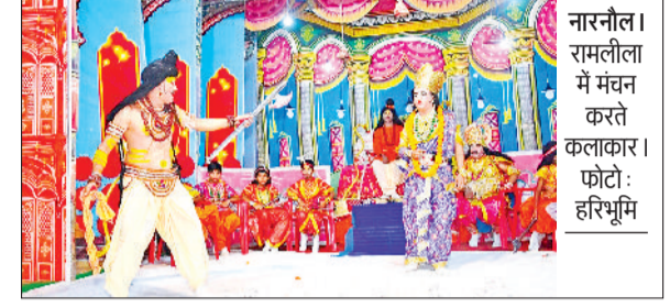
नारनौल। रामलीला में मंचन करते कलाकार।