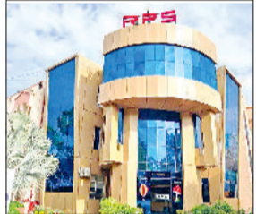
महेन्द्रगढ़। आरपीएस विद्यालय।