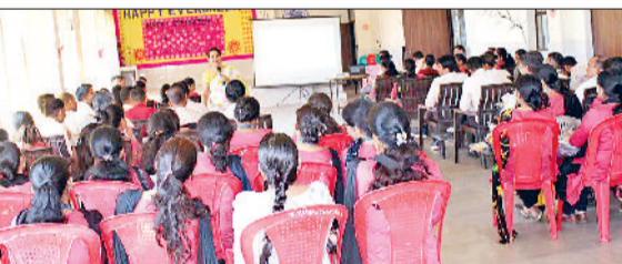
महेन्द्रगढ़। वेबिनार में मौजूद अध्यापक।

अभिभावकों के समक्ष घोषणा की कि इस स्कॉलरशिप के आधार पर बीते वर्ष की तरह ही कक्षा 11वीं के 120 बच्चों को सुपर 30 के माध्यम से हॉस्टल सहित विद्यालय स्तर की पूर्ण शिक्षा निःशुल्क दी जाएगी।