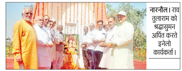
नारनौल। राव तुलाराम को श्रद्धासुमन अर्पित करते इनेलो कार्यकर्ता।