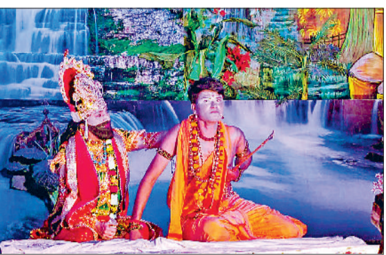
महेन्द्रगढ़। लीला का मंचन करते कलाकार।