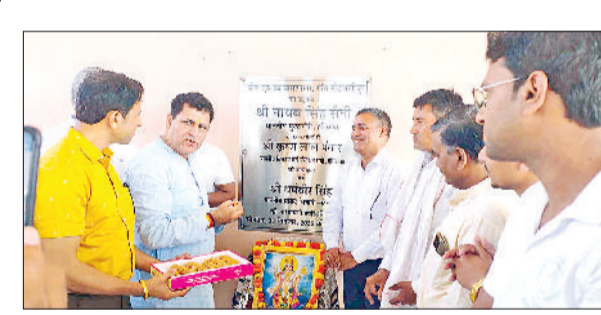
निजामपुर। सैदअलीपुर में निर्मित योगशाला का आॅनलाइन लोकार्पण समारोह में शामिल ग्रामीण।