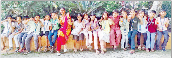
महेन्द्रगढ़। शिक्षक भ्रमण करते विद्यार्थी।