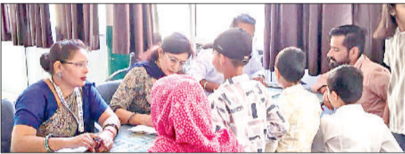
नारनौल। पीटीएम में भाग लेते अध्यापक-अभिभावक।