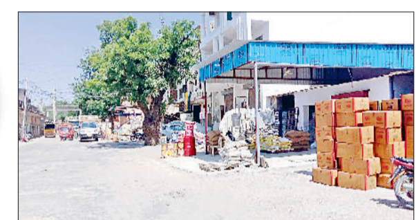
महेंद्रगढ़। बाजरे की आवक के इंतजार में महेंद्रगढ़ की अनाज मंडी।

महेंद्रगढ़ जिले में बाजरे की बंपर रिपोर्ट तोड़ पैदावार हुई