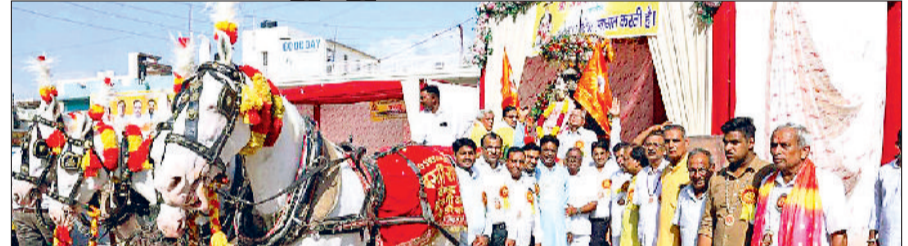
नारनौल। महाराजा अग्रसेन का डोला निकालते हुए।

विद्यार्थियों ने सांस्कृतिक प्रस्तुतियों से मोहा मन हरिभूमि न्यूज ►► नारनौल