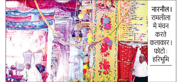
नारनौल। रामलीला में मंचन करते कलाकार।